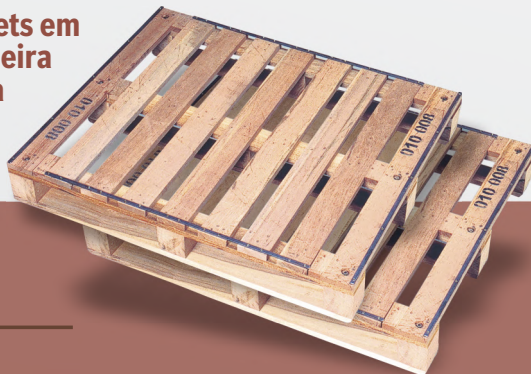
Pallets em madeira dura