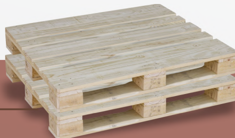
Pallets reforçados com 4 entradas