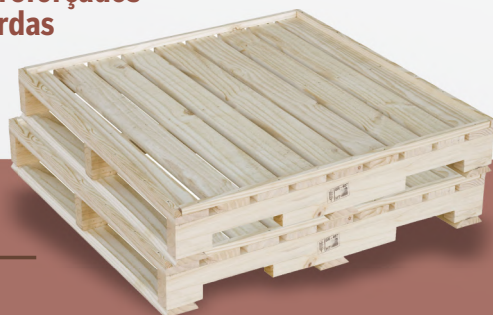
Pallets reforçados com bordas